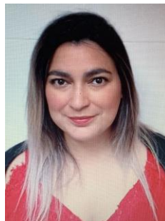
Paula Jamasmie Comunicaciones