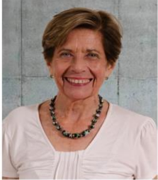
Beatrice Ávalos Presidenta